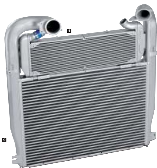
1 Kühler für Abgasrückführung 2 Ladeluftkühler